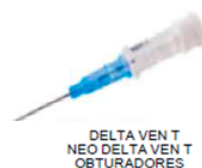
DELTA VEN T NEO DELTA VEN T OBTURADORES

GRANDE CAPACIDADE MANUAL TAMBÉM NO CASO DE PELE DURA. OBTURADORES DE ENTRADA ÚNICA ESTÃO DISPONÍVEIS PARA TODOS OS CALIBRES. (EXCETO PARA 26G).