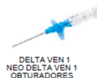
DELTA VEN 1 NEO DELTA VEN 1 OBTURADORES

GRANDE CAPACIDADE MANUAL TAMBÉM EM CASO DE PELE DURA. OBTURADORES DE ENTRADA ÚNICA ESTÃO DISPONÍVEIS PARA TODOS OS CALIBRES. (EXCETO PARA 26G).