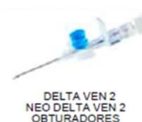
DELTA VEN 2 NEO DELTA VEN 2 OBTURADORES

GRANDE CAPACIDADE MANUAL TAMBÉM EM CASO DE PELE DURA. OBTURADORES DE ENTRADA ÚNICA ESTÃO DISPONÍVEIS PARA TODOS OS CALIBRES. (EXCETO PARA 26G).